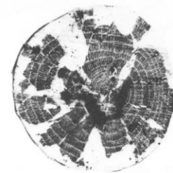
Mostră de la Demircihöyük cu 12 inele (datare imposibilă)